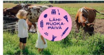
MTK:n Lähirookapäivää juhlistaan 9.9.2023. – ilmoittaudu järjestäjäksi nyt!